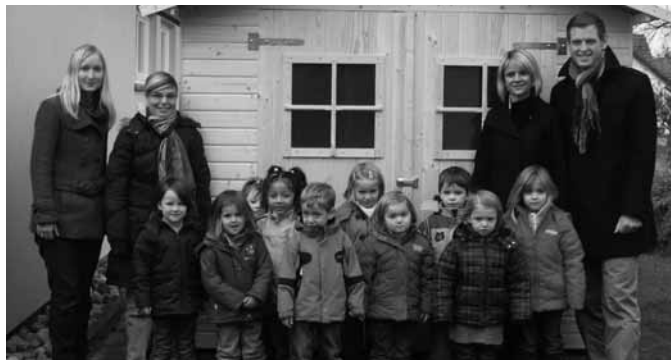
Foto: Gewinnübergabe im Kindergarten Don Bosco in Herbertingen

die zahlreichen Wünsche in der Erlebnisbrauerei ein. Eines ist für das sympathische Brauerei-Ehepaar jetzt schon klar: „Diese schöne Aktion wiederholen wir im nächsten Jahr!“